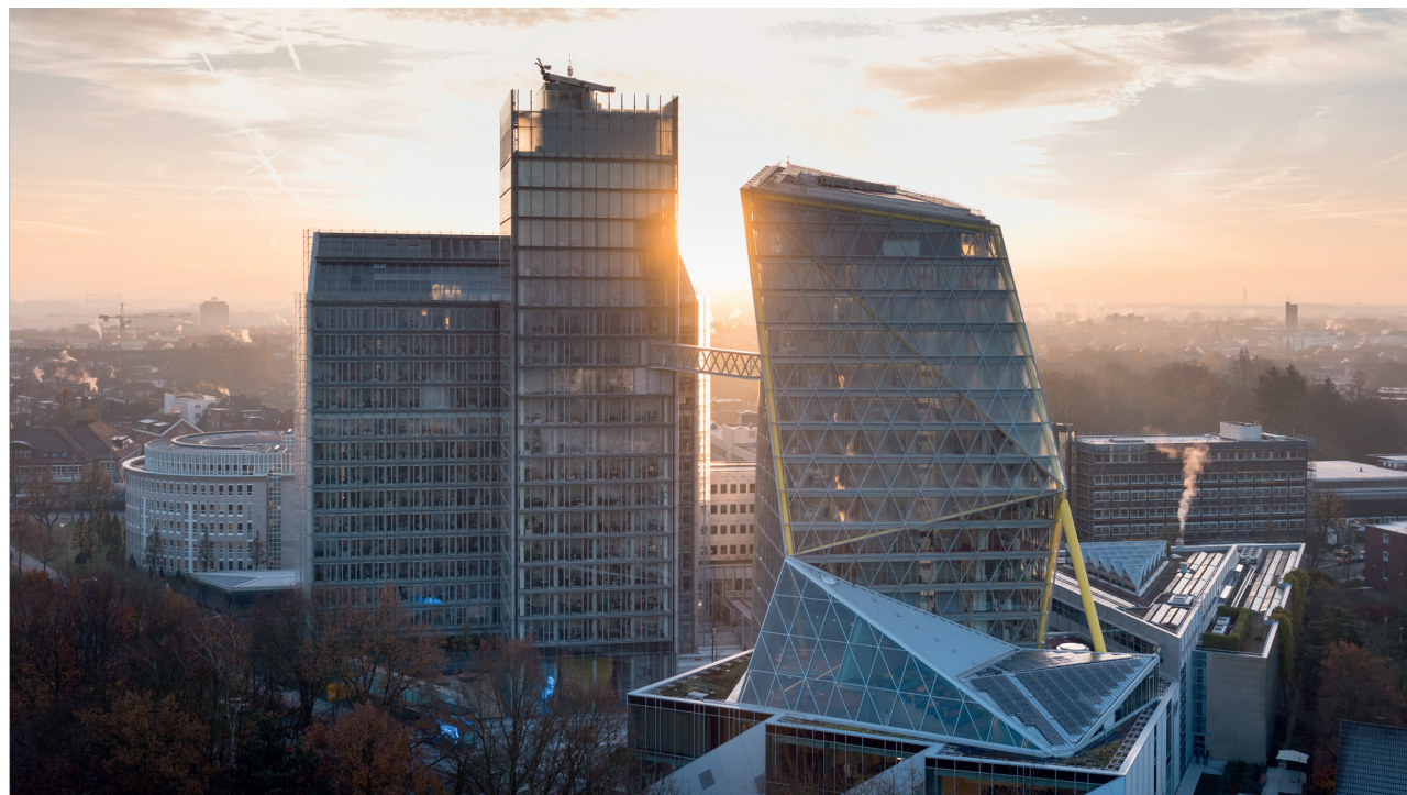
Le torri LVM di Münster all'alba